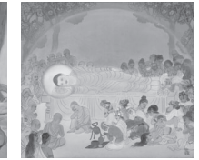
G: 涅槃 (ねはん)