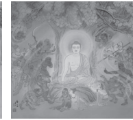
E: 成道 (じょうどう)