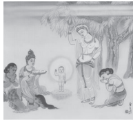
B: 降誕 (ごうたん)