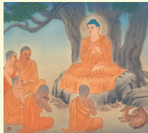
転法輪 (てんぽうりん)