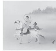
C: 出城 (しゅつじょう)