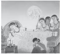
A: 託胎 (たくたい)

※今回ご記入いただきました個人情報は、お申込みの照会のみで使用させていただきます。