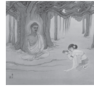
D: 牧女の供養 (もくによのくよう)