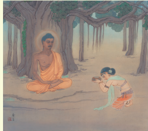
牧女の供養 (もくによのくよう)