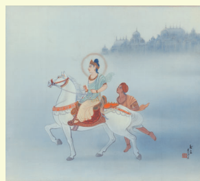
出城 (しゅつじょう)

龍谷大学 龍谷ミュージアム主催 シリーズ展3 仏教の思想と文化—インドから日本へ— (二〇一九年一月九日〜三月二十四日) 特集展示 仏教美術のいきものがたり 出展記念企画